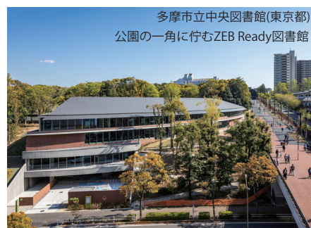
多摩市立中央図書館(東京都) 公園の一角に佇むZEB Ready図書館